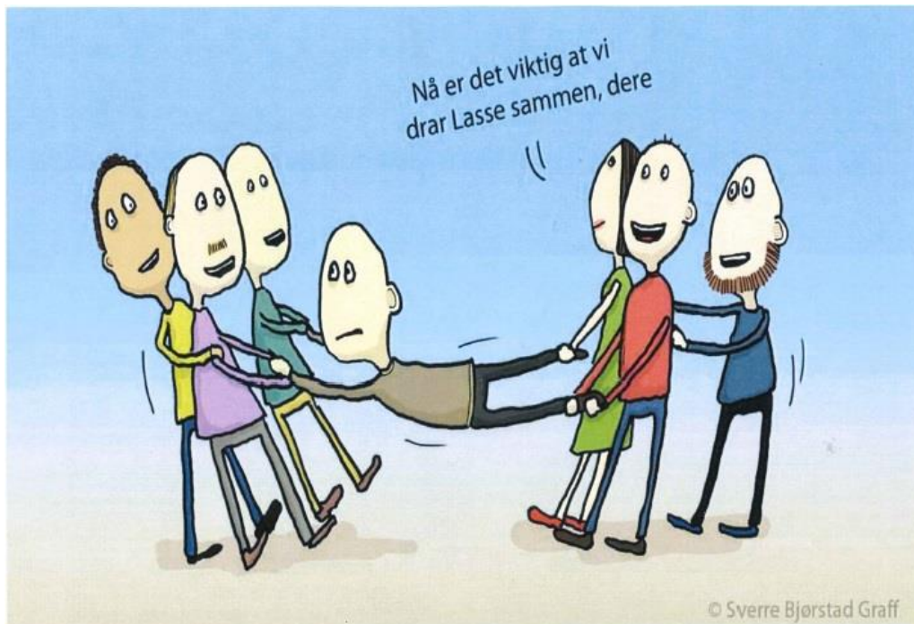
Samholdet 1 - Lasse 0